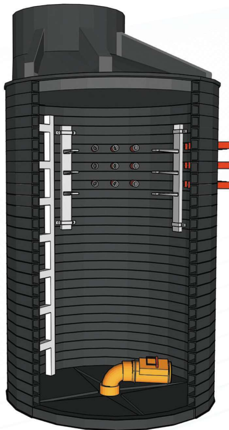
Рис. 3. Типовой сварной кабельный колодец FD

Технология производства спирально-витой трубы позволяет обеспечить большие показатели кольцевой жесткости трубы при существенном уменьшении ее массы. Материал обеспечивает высокую устойчивость трубы к